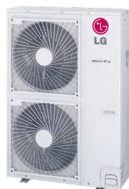
ARUN040LSSO ARUN050LSSO ARUN060LSSO

Pour plus d'informations consultez le site : www.eurovent-certification.com