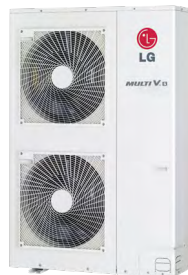
ARUN080LSSO ARUN100LSSO ARUN120LSSO